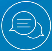
Psychologische Beratung & Behandlung

Wir sind ein internationales und kultursensibel arbeitendes Team aus Psycholog*innen, Sozialpädagog*innen, Kulturexpert*innen, Kunsttherapeut*innen und Teamassistent*innen.